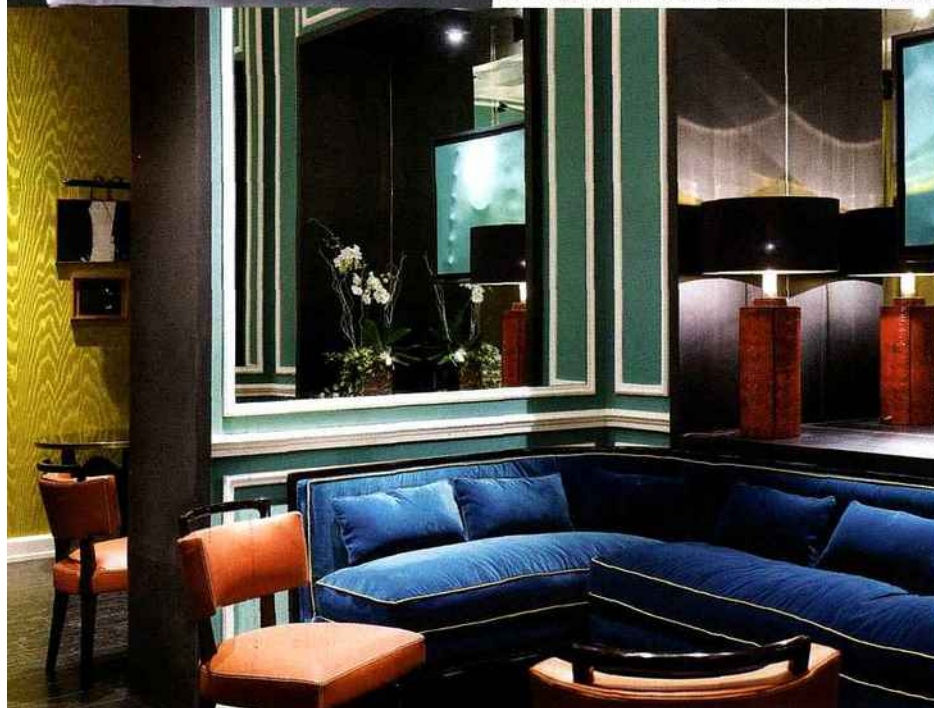
3 SALON COSY AUX MILLE REFLETS Au J.K. Café, les regards se perdent dans les miroirs qui cloisonnent les petits salons d'invités. Une excellente idée pour démultiplier à l'infini un espace feutré. Et simuler les mètres carrés qui manquent. Michele opte ici pour un éventail de couleurs chatoyantes où orangés, verts, bleus et jaune moiré se mélangent sans fausse note.