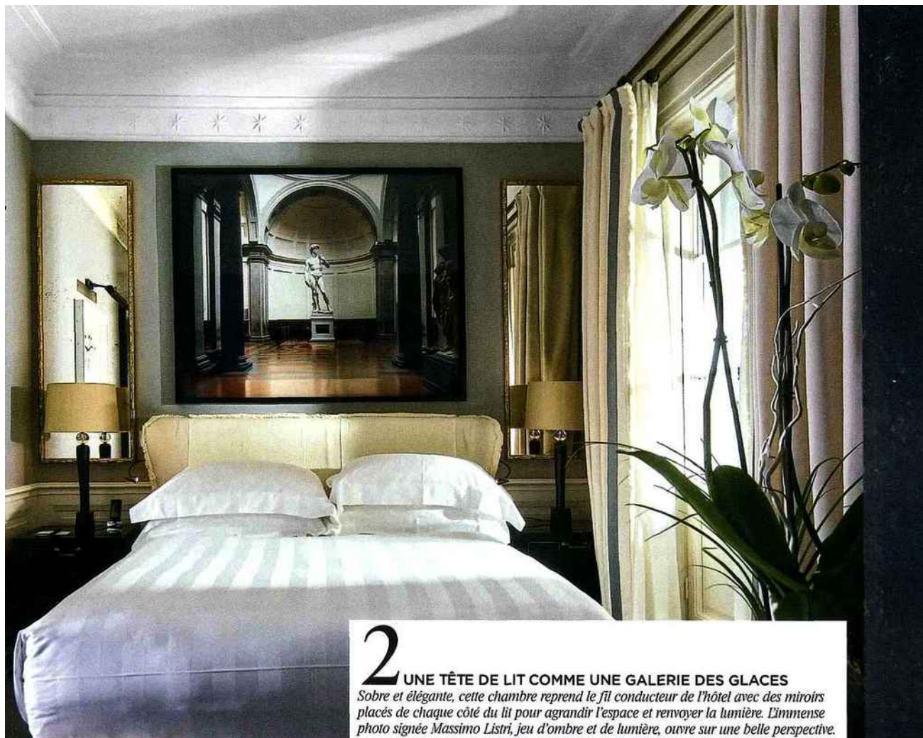
2 UNE TÊTE DE LIT COMME UNE GALERIE DES GLACES Sobre et élégante, cette chambre reprend le fil conducteur de l'hôtel avec des miroirs placés de chaque côté du lit pour agrandir l'espace et renvoyer la lumière. L'immense photo signée Massimo Listri, jeu d'ombre et de lumière, ouvre sur une belle perspective.